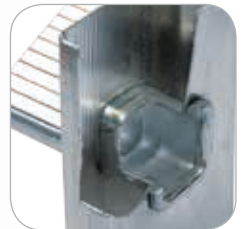
Dreifach geweitete und gebördelte Stufen-Holm Verbindung.