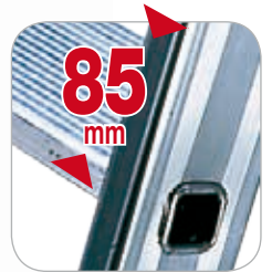
Stufenbreite 85 mm.