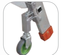
Vordere Rollen: drehbar und selbstsperrend Ø 80 mm.