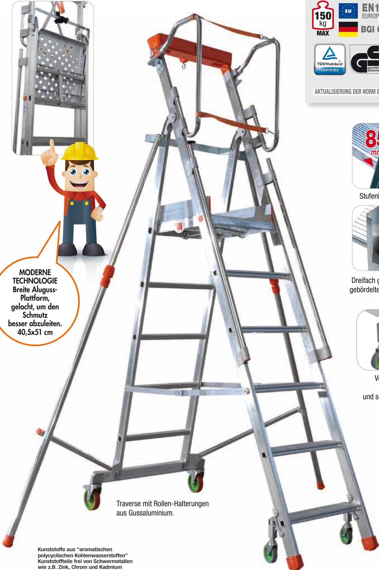
Traverse mit Rollen-Halterungen aus Gussaluminium.

MODERNE TECHNOLOGIE Breite Aluguss-Plattform, gelocht, um den Schmutz besser abzuleiten. 40,5x51 cm